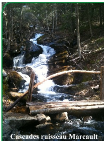
Cascades ruisseau Marcault