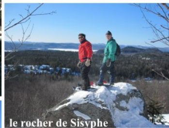
le rocher de Sisyphe