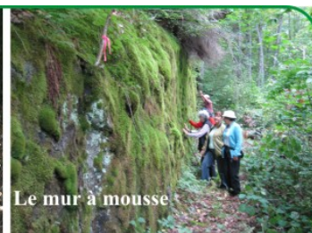
Le mur à mousse