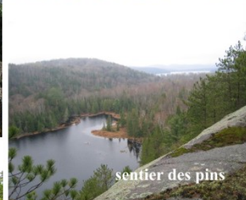
sentier des pins

© 2011 texte, photos graphisme Richard Chartrand