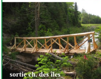
sortie ch. des îles